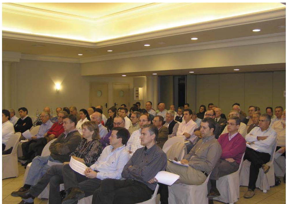
Junta General Ordinaria del Colegio Oficial de Ingenieros de Minas de Levante.

La Orden CIN/310/2009, de 9 de febrero, por la que se establecen los requisitos para la verificación de los títulos universitarios que habiliten para el ejercicio de la profesión de Ingeniero de Minas, recoge los objetivos básicos y las competencias del nuevo título, entendidas como habilidades, conocimientos, destrezas, etc. a adquirir